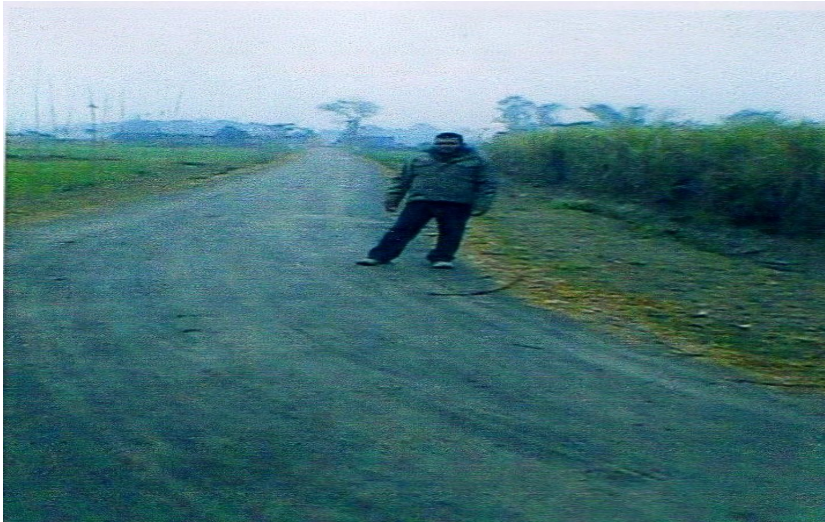
Village- Dingura jote , Habitation- Fattupurwa