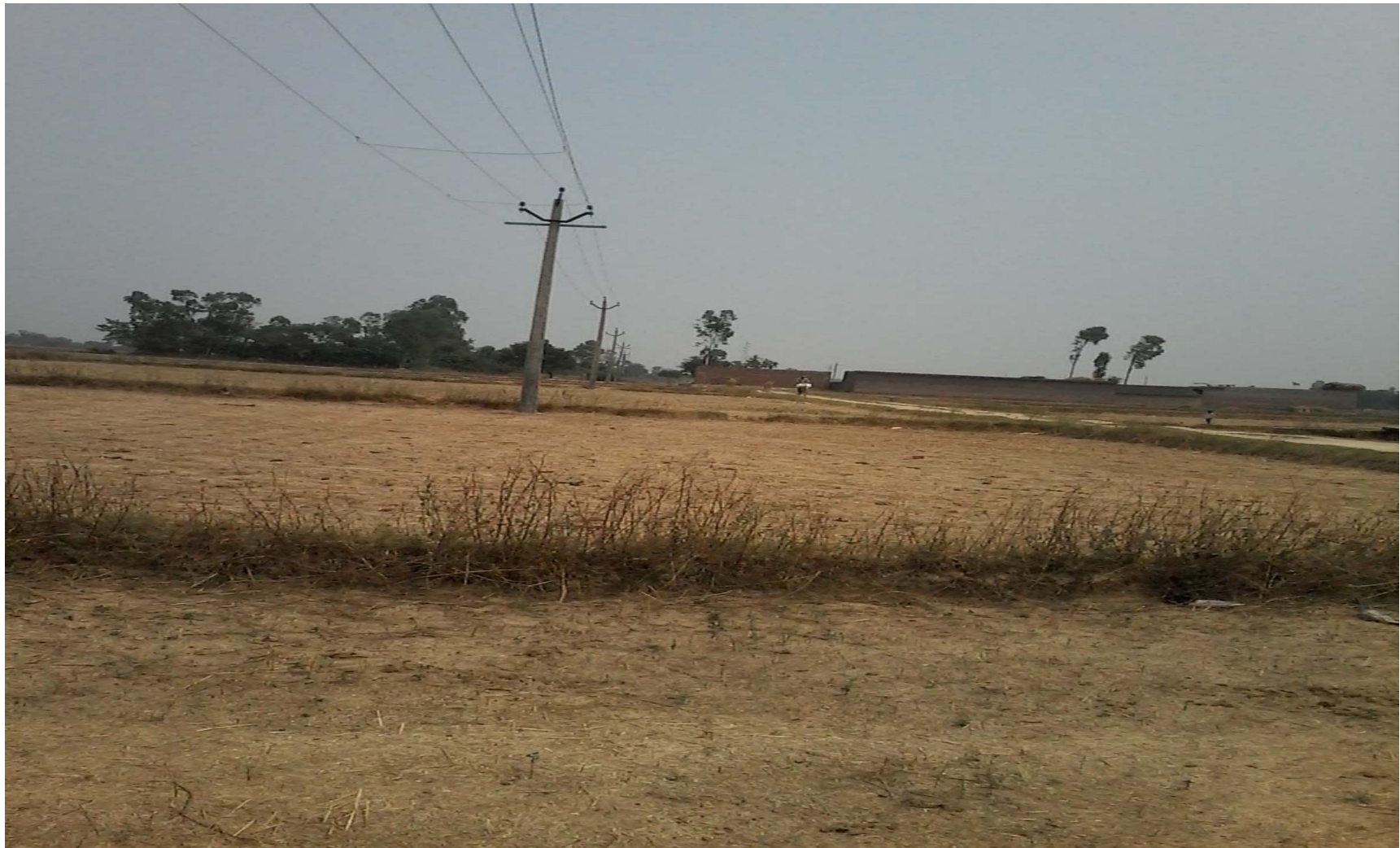
Village –Dingurajote Department- Hydil