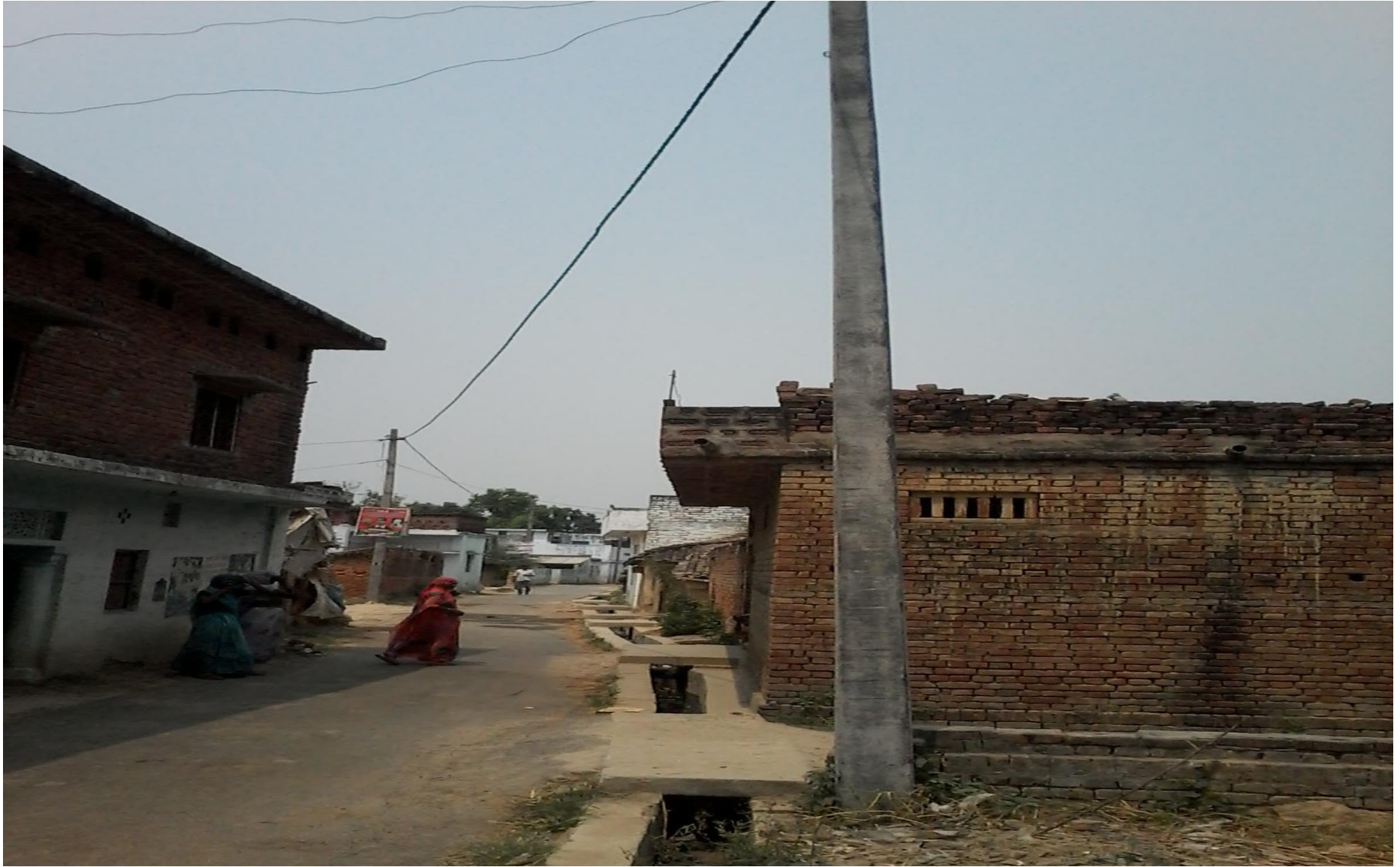
Hydil- Tiwari Gaun